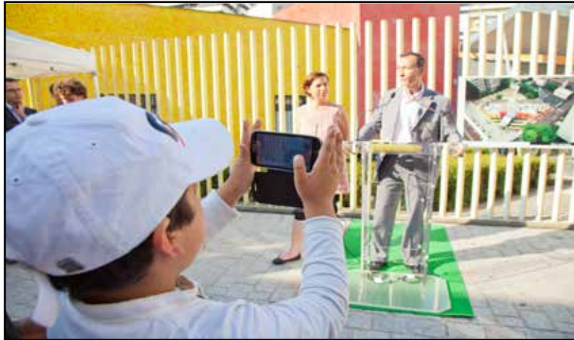
Inauguration Quartier Michelet - Juillet 2013

Tout au long de l'année, l'association documente par la photographie les événements festifs et rencontres organisés par les acteurs de la vie locale.