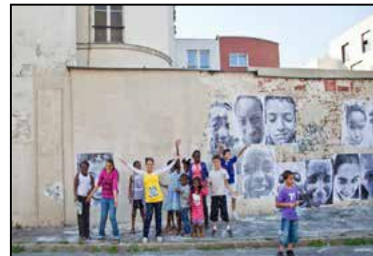
Exposition rue Archereau - fête de quartier Paris 19 - 2011