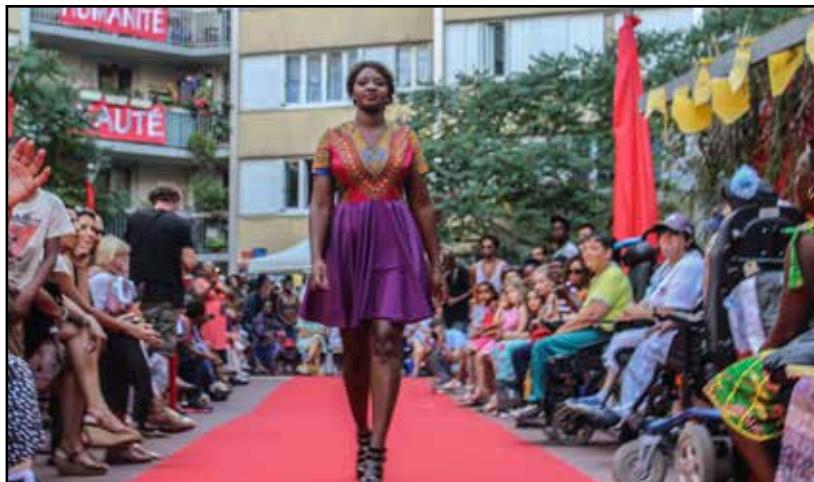
Défilé «Les Couleurs de Pont de Flandre» - Août 2016