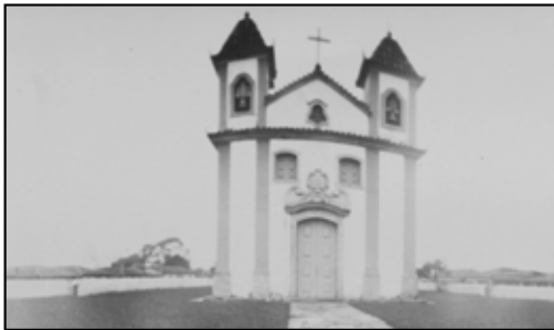
Sténopé - Lavras Novas, MG - 2016

Conçues sous forme de dialogues entre les publics parisien et brésilien, ces actions sont aussi l'occasion de faire voyager le 19 ème arrondissement et ses artistes.