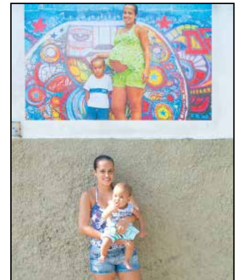
Rio de Janeiro - 2014 (Street Art de Da Cruz) - Paris 19