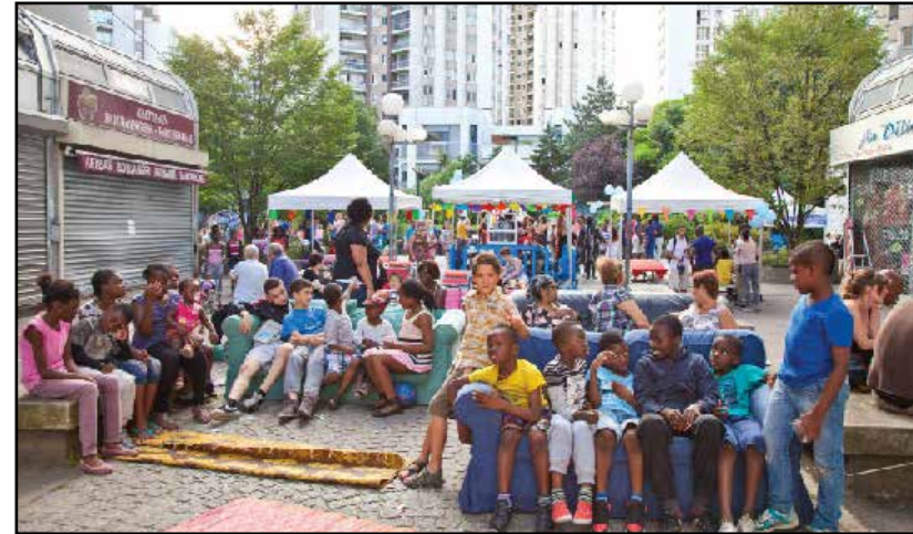
Repas Partagé - Orgues de Flandre - Juillet 2014