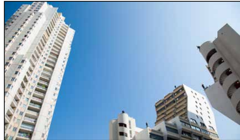
Les souffleurs aux Orgues de Flandre - Hiver 2016