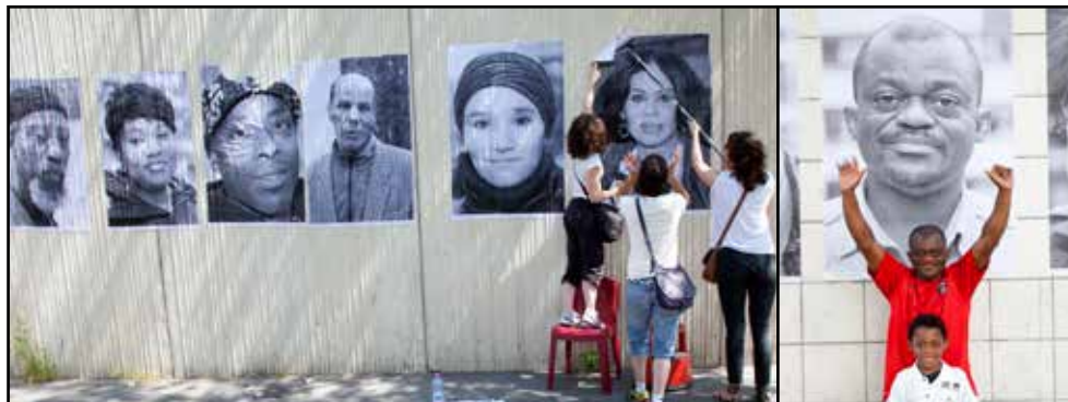
Exposition pour l'inauguration du nouveau quartier Michelet Paris 19 - Juillet 2013

Les portraits réalisés par Clichés Urbains sont affichés en grand format et en plein air dans le quartier au cours d'expositions happenings réalisées avec le soutien de nos partenaires (Inside Out Project de JR, Associations du quartier, Collectivités et Politique de la Ville).