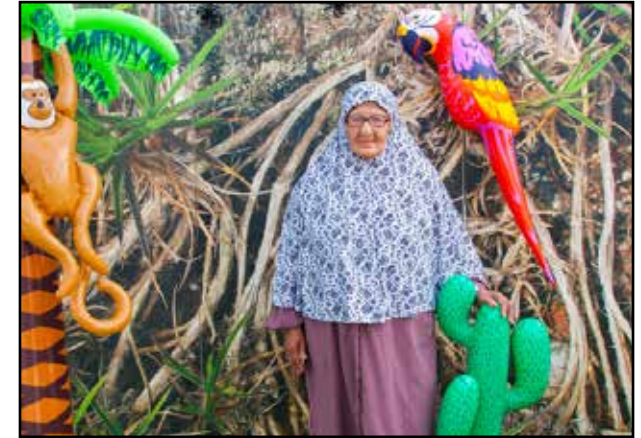
Fête Curial - Juin 2013

Inspiré de la tradition photographique africaine, le studio mobile de l'association propose aux habitants de se faire tirer le portrait par un professionnel sur divers fonds ou décors. Les images sont imprimées sur le champ et/ou mises à disposition sur internet.