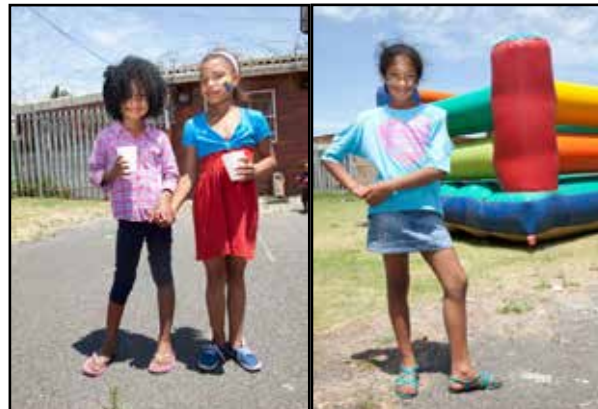
Fête de Noël, Manenberg, 2012

Chacun de ces voyages est également l'occasion de tisser des liens entre le public parisien de Clichés Urbains et les jeunes d'ailleurs, d'encourager les curiosités, développer les échanges, élargir les horizons, la notion de semblable, et le champ des possibles.