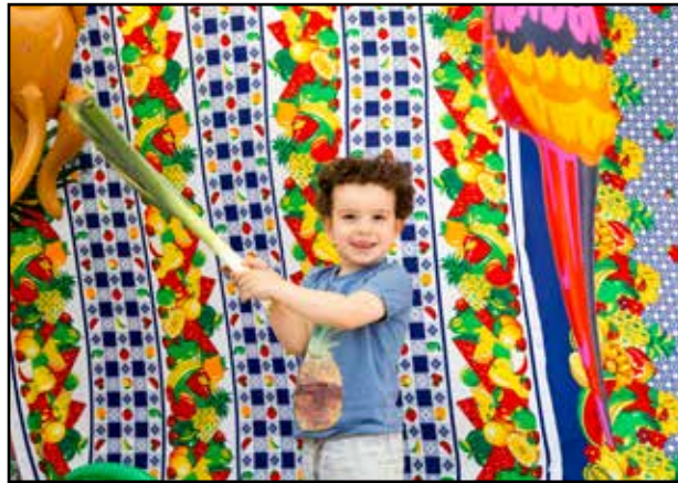
Biodiversité - Village de la Récup - 2016