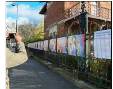
Exposition anti-gaspi place de la Mairie Semaine de la SERD - Paris 19 - 2016