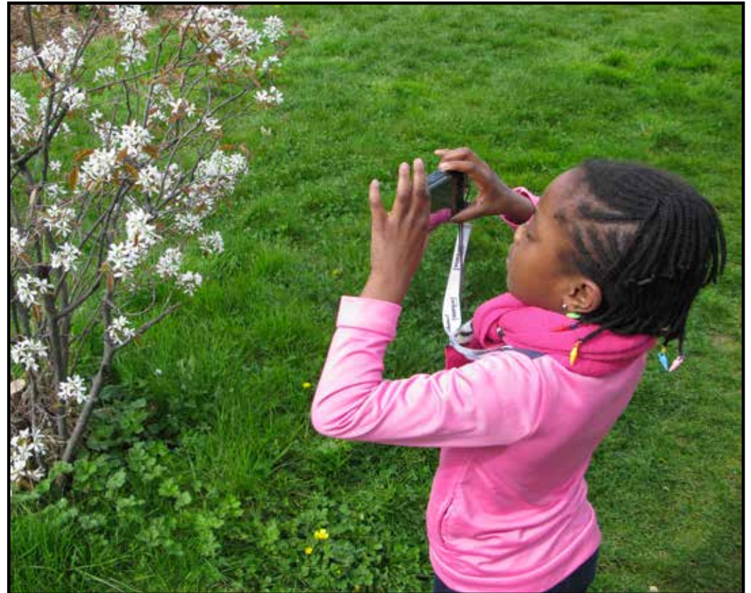
Niamey, 7 ans - Ateliers 2016 - «Nature dans la ville»