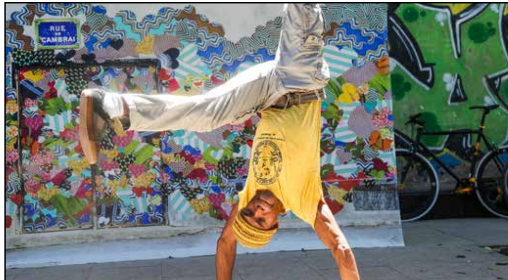
Studio - Rio de Janeiro - 2014 (Street Art de Myriam Maxo & les couleurs du Pont de Flandre) - Paris 19