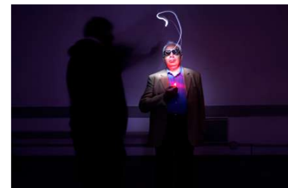
LIGHTGRAFF La lumière comme outils de création