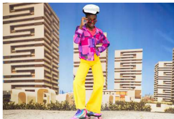
STUDIO RÉTRO Les habitant.e.s retournent dans le passé à la découverte de la résidence curial