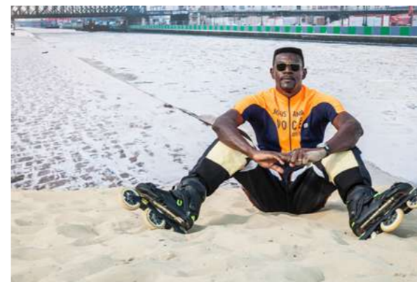
STUDIO PARIS RIO Hommage photographique aux deux capitales, Paris et Rio