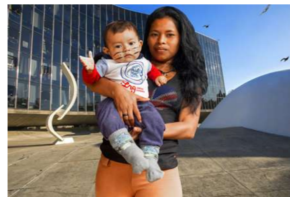
STUDIO NIEMEYER AILLEURS Hommage à l'architecte Oscar Niemeyer afin de célébrer la solidarité