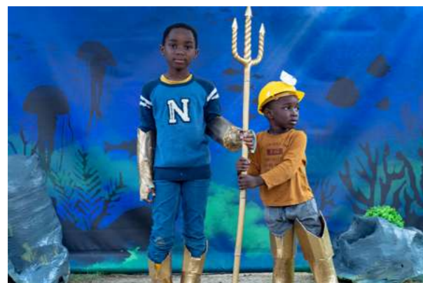
LES SUPER HÉROS DE L'EAU Nos héro.ine.s affrontent les mauvaises habitudes de consommation