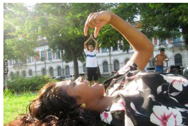
PERSPECTIVE Le photomontage manuel