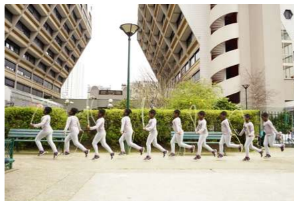
CHRONOPHOTOGRAPHIE La décomposition du mouvement