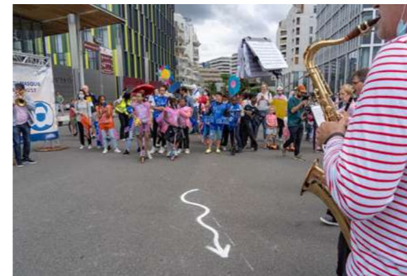
NANTERRE (APES) Reportage photo, juillet 2021

Documentez (en photo et/ou vidéo) un projet, un territoire, vos séminaires, conventions ou évènements.