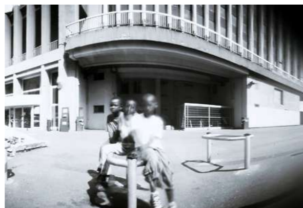
STÉNOPE La photo argentique dans une boîte de conserve