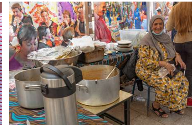
LA RUE AUX ENFANTS (CAFÉ ZOÏDE) Reportage photo, octobre 2020