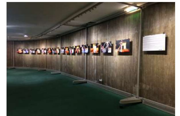
SAMBA NA AVENIDA Parti Communiste Français, 2018.