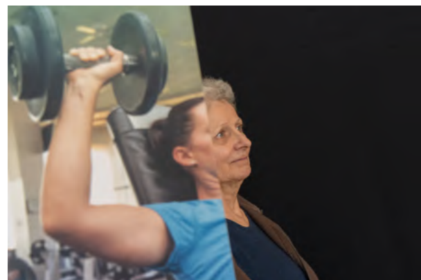
SLEEVEFACE Le photocollage manuel