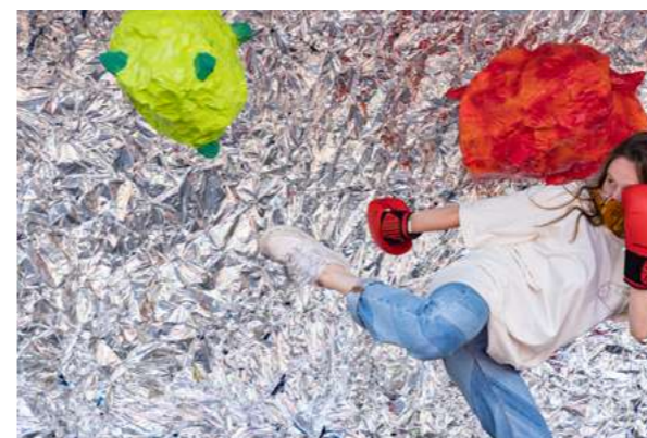
STUDIO VADE RETRO VIRUS Avec humour, le public affronte le virus grâce aux règles sanitaires