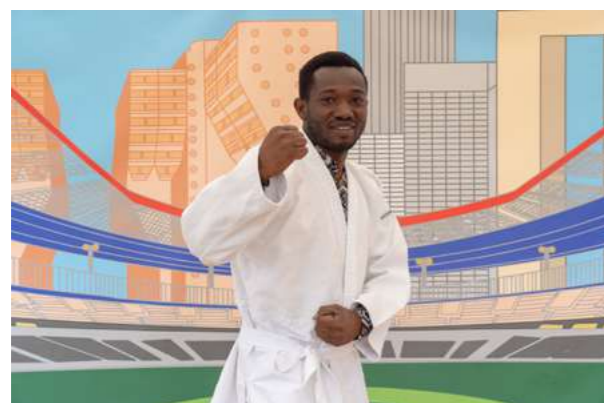
LES JO DONT VOUS ÊTES LES HÉROS Parents et enfants interprètent les athlètes de demain