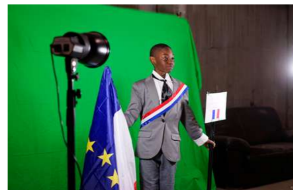
MOI PRÉSIDENT.E Le portrait présidentiel