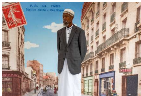
FLANDRE EN PHOTOS Les habitant.e.s retournent dans le passé à la découverte du quartier