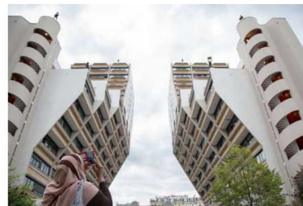
ATELIER ARCHITECTURE Redécouvrir le quartier par la photographie