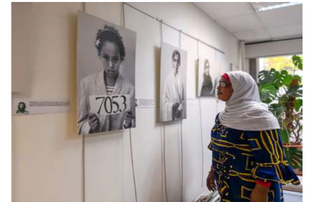
LES GRAND.E.S HUMAIN.E.S La régie de quartier, 2018.