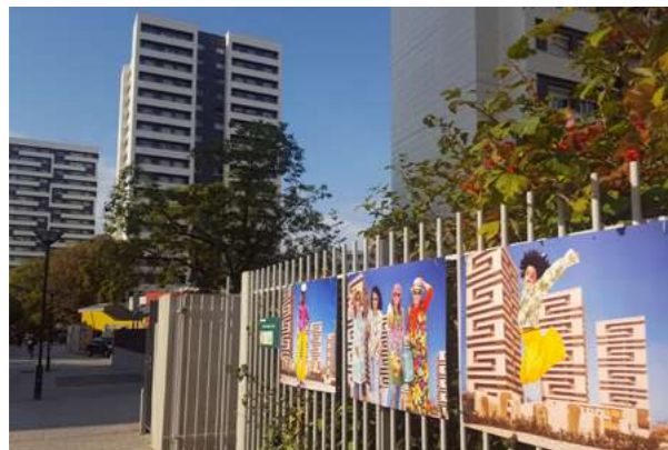
STUDIO RETRO Résidence Michelet, 2019.