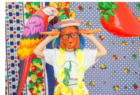
STUDIO NATURE Studio coloré sur la thématique de la nature et de l'écologie