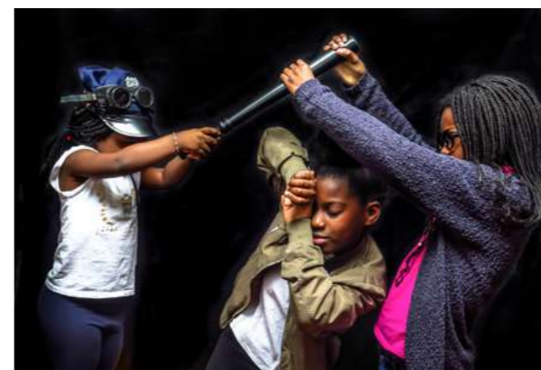
PHOTOGRAPHIE TON DROIT La mise en scène d'images sur le thème des droits de l'enfant