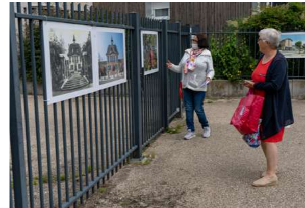
LES CLAYES-SOUS-BOIS Le chemin de ronde, 2021