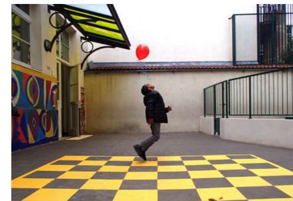
ATELIER JEUX PHOTOS Des jeux originaux pour découvrir les propriétés optiques