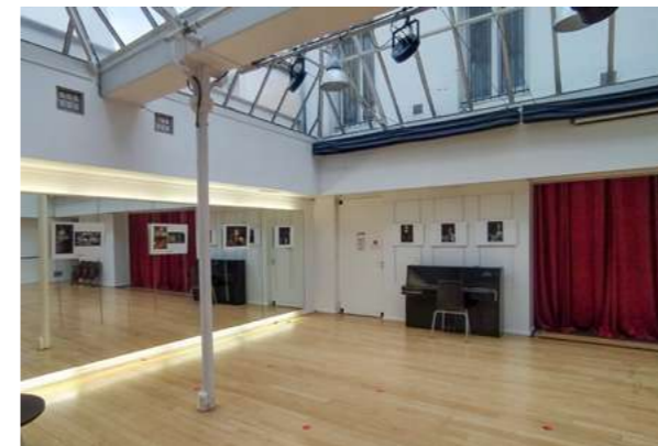
ATELIERS ÉTUDIANT.E.S AU CROUS Le Crous de Paris, 2020