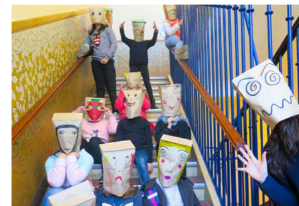
ATELIER MASQUÉ.E.S La création de personnages à partir de masques