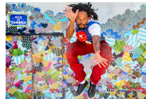
STUDIO DIASPORAMA Le public pose devant une œuvre de street art afro-parisienne