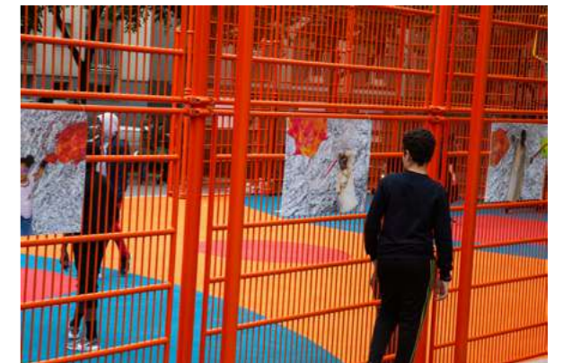
VADE RETRO VIRUS Place Alphonse Allais, 2020