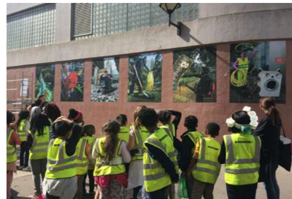
LES SUPER HÉROS DES DÉCHETS Les Orgues de Flandre, 2018.