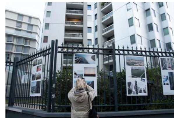
POINT D'ORGUES Les Orgues de Flandre, 2018.