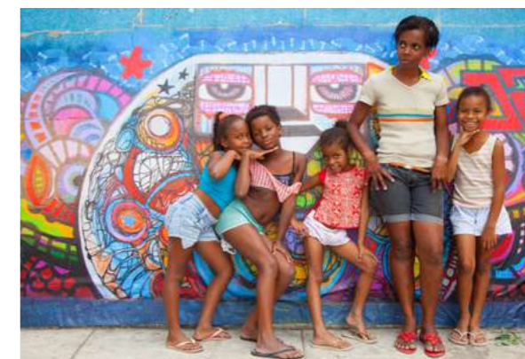
STUDIO UM NOVO OLHAR Hommage aux habitant.e.s du quartier de Morro da Providência