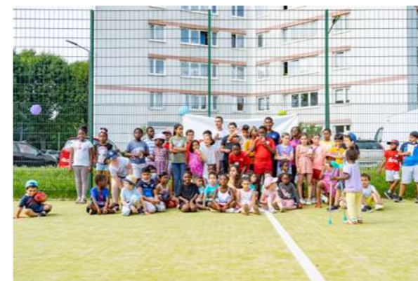
VILLEJUIF (BATIGÈRE) Reportage photo, juillet 2021