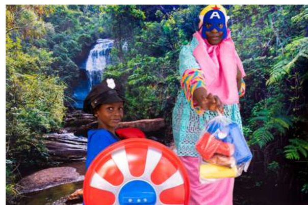
LES SUPER HÉROS DES DÉCHETS Parents et enfants enfilent leurs costumes et affrontent la pollution