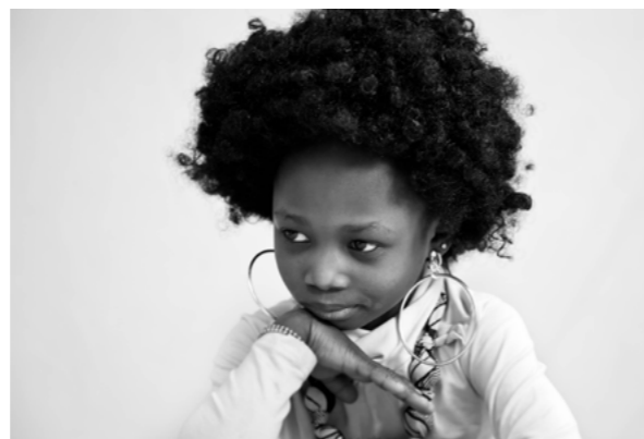
STUDIO GRAND.E.S HUMAIN.E.S Parents et enfants interprètent les héro.ine.s d'hier et d'aujourd'hui