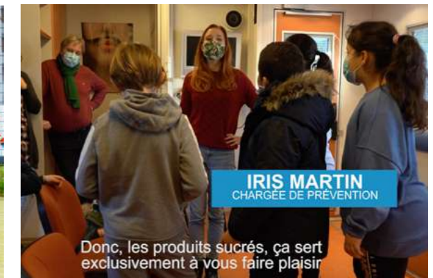
MESNIL-LE-ROI, PROJET JBUS (IFC) Reportage vidéo, septembre 2020