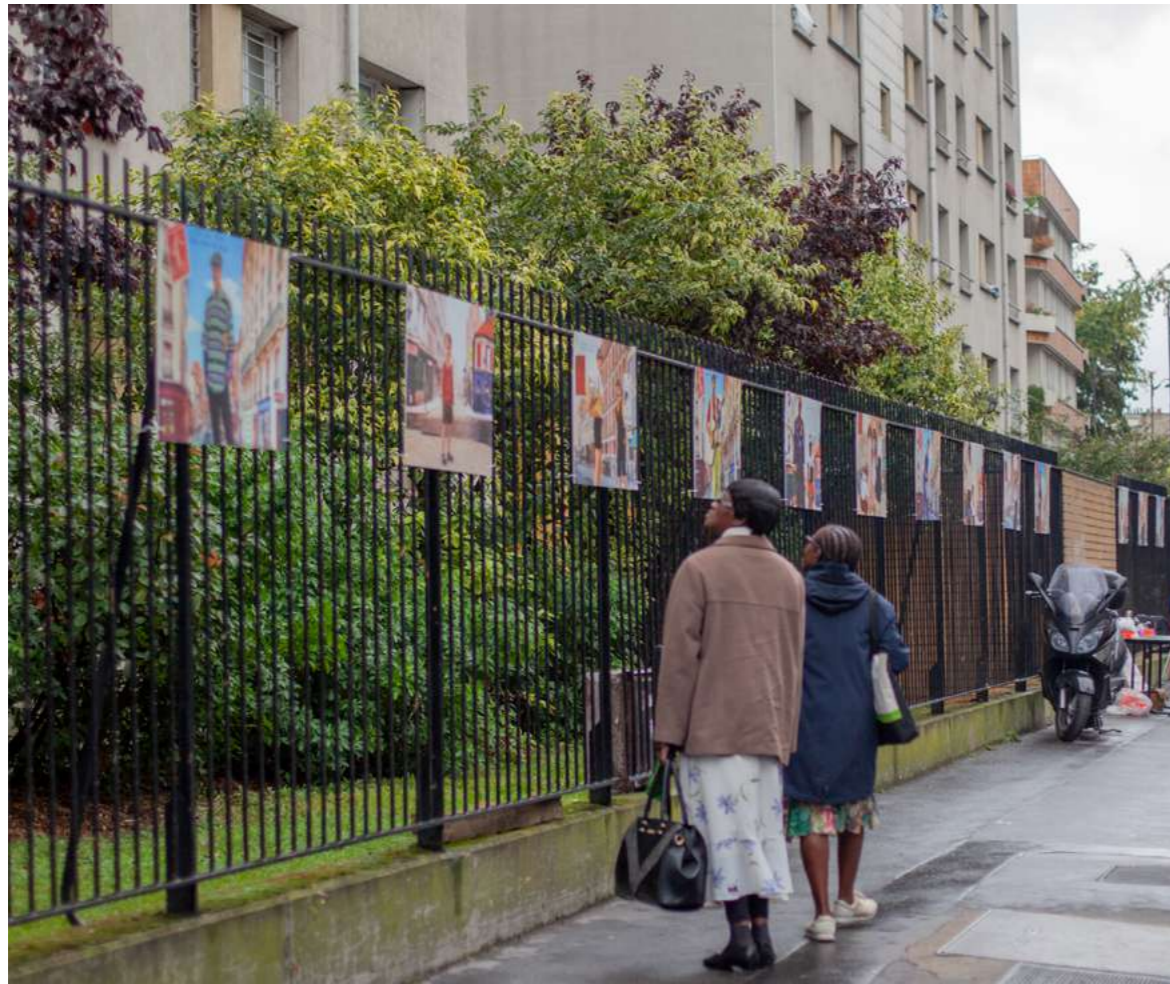
EXPOSITION FLANDRE EN PHOTOS Quartier Riquet-Aubervilliers, 2019.