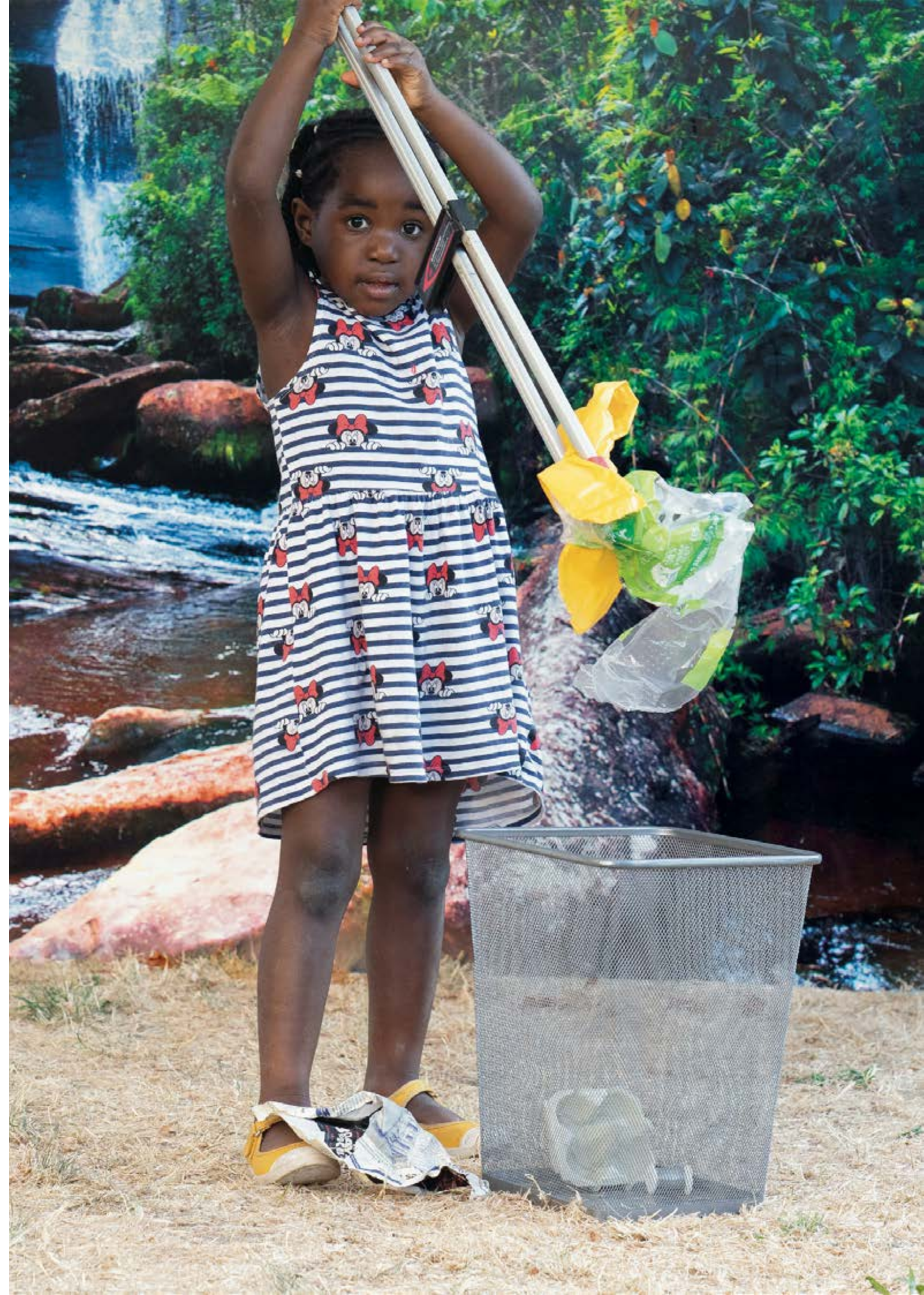
01. Studio Les super héros des déchets, 2020 02. Studio Les super héros des déchets, 2020 03. Studio Les super héros des déchets, 2020