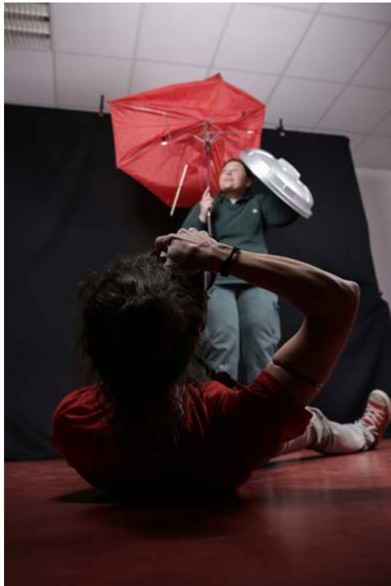
01. Studio Les super héros des déchets, 2018

Nous contacter infos@cliches-urbains.org