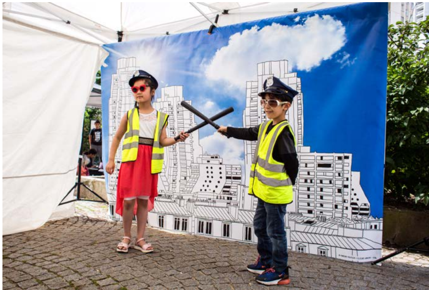
01. Studio Les Orgues de Flandre, 2016

Ouverts à tous.tes et participatifs, les studios photo de Clichés Urbains sont d'abord des animations ludiques et innovantes, gratuites pour le public, qui s'installent dans la rue, ou des événements conviviaux. Il s'agit pour les participant.e.s de se mettre en scène, seul.e.s ou en petits groupes, paré.e.s des accessoires de leurs choix, et de prendre la pose, devant le décor et la thématique proposés, pour interpréter librement une attitude ou un personnage. Une fois la photo faite, le portrait imprimé est mis à disposition des participant.e.s sur le champ. Le format numérique de l'image leur est partagé le lendemain.